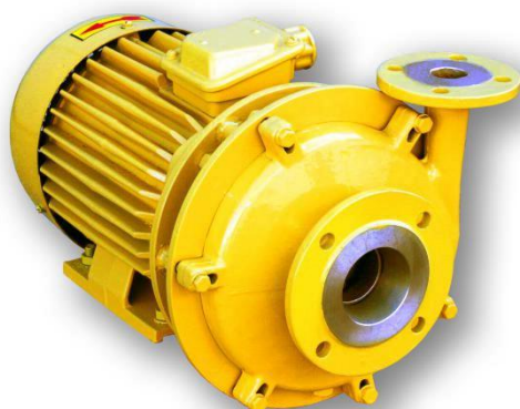
Насос серии ХМ 50-32-200К